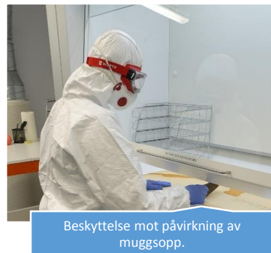
Beskyttelse mot påvirkning av muggsopp.

Muggsaneringsavdelingen i Fylkesarkivet i Oppland/IKA Opplandene er et isolert sterilt rom med eget ventilasjonsanlegg og eget magasin til infiserte dokumenter. På grunn av helsefare er arbeidstiden i muggsanering begrenset til maks to timer om dagen for en person. Det viktigste er at personer som jobber med sånne dokumenter blir beskyttet mot muggsopps påvirkning. Til dette bruker vi blant annet ansiktsmasker, vernebriller og full vernedrakt.