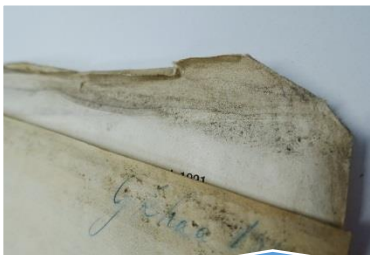
Muggsopp på gamle dokumenter.

For arkivmiljøet er hovedfokuset muggsoppens påvirkning på papir. Muggsopp kan utskille enzymer som splitter opp papirets cellulose, produsere organiske syrer som skader papiret og pigmenter som er ansvarlig for å forårsake irreversibel misfarging, men også vann som ødelegger papirets fasthet.